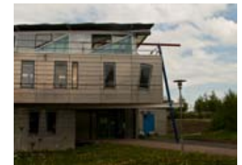
Das Visualisierungsinstitut der Universität Stuttgart hat seinen Sitz im ehemaligen HYSOLAR-Gebäude.